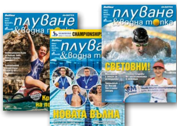
„Плуване & Водна топка“